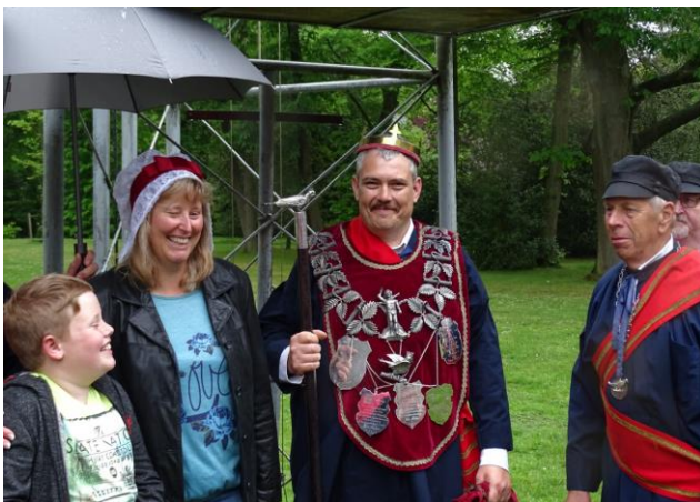
De 'Koning' voor drie jaar met trotse familie en hoofdman!

Ook in het Gilde is er een koning, elke 3 jaar is er een koningschieting op de staande wip (27 meter hoog). Wie het eerst het hoogste vogeltje afschiet is voor drie jaar 'Koning'. Wie dat drie keer kan, dus negen jaar koning is, wordt dan 'Keizer' en krijgt een bijzonder groot ereteken (breuk) in zilver, speciaal voor hem gemaakt. Dit is nog maar ooit één keer gebeurd in 500 jaar.