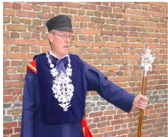
De 'Keizer' van het Gilde van Essen, voor het leven!