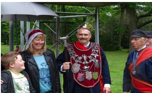
De 'Koning' voor drie jaar met trotse familie en hoofdman!

Ook in het Gilde is er een koning, elke 3 jaar is er een koningsschieting op de staande wip (27 meter hoog). Wie het eerst het hoogste vogeltje afschiet is voor drie jaar 'Koning'. Wie dat drie keer kan, dus negen jaar koning is, wordt dan 'Keizer' en krijgt een bijzonder groot ereteken (breuk) in zilver, speciaal voor hem gemaakt. Dit is nog maar ooit één keer gebeurd in 500 jaar.