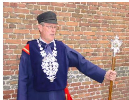
De 'Keizer' van het Gilde van Essen, voor het leven!